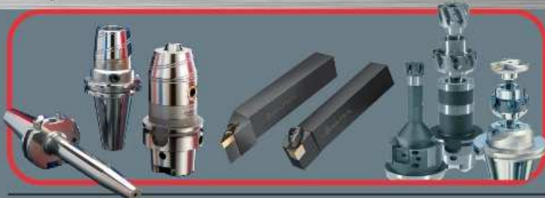
Nosači i Pihvati Alata