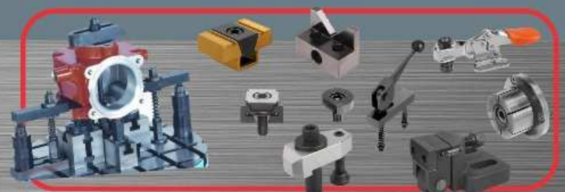
Sistemi Steznih Alata