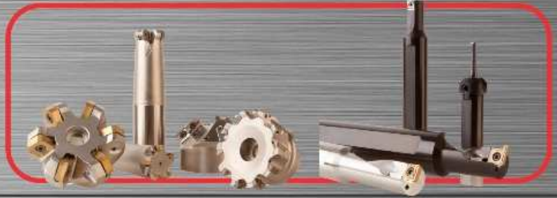
Izmjenjivi Rezni Alati